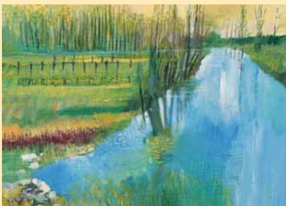
Le risorgive di Codroipo

Stampa: Tipografia Moro Andrea srl - Tolmezzo (Ud)