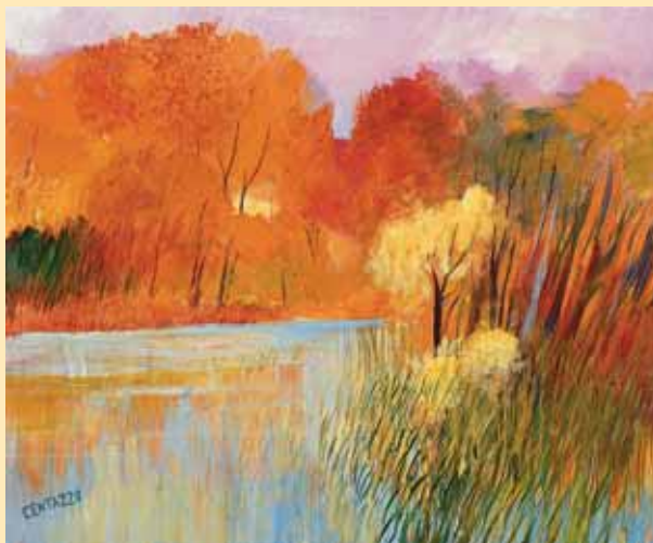
Autunno sul Varmo