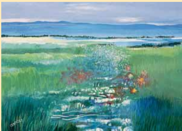
Fiori sui Magredi e il Piancavallo