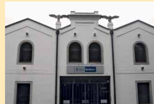
Veduta della BCC di Basiliano, sede di Codroipo