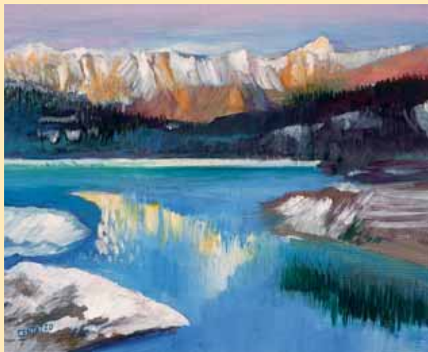
Luci e riflessi sul lago