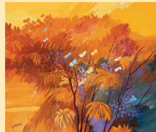
Farfalle sul vigneto