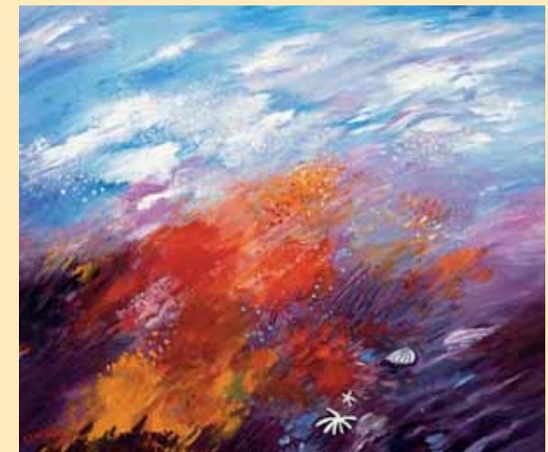
Mareggiata sugli scogli